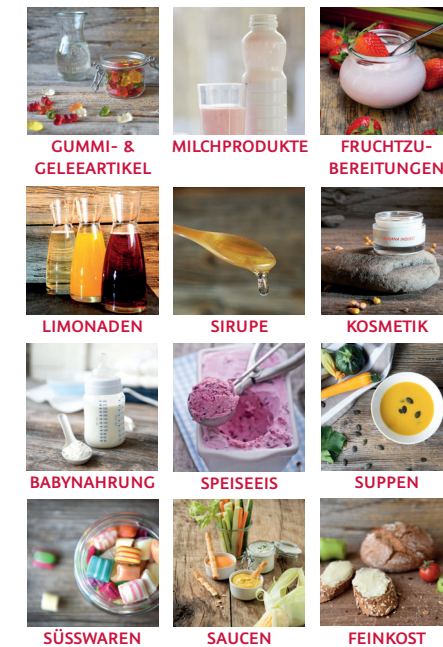
GUMMI- & GELEEARTIKEL