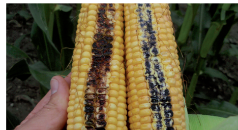
Jodtest – links Wachsmais, rechts Gelbmais